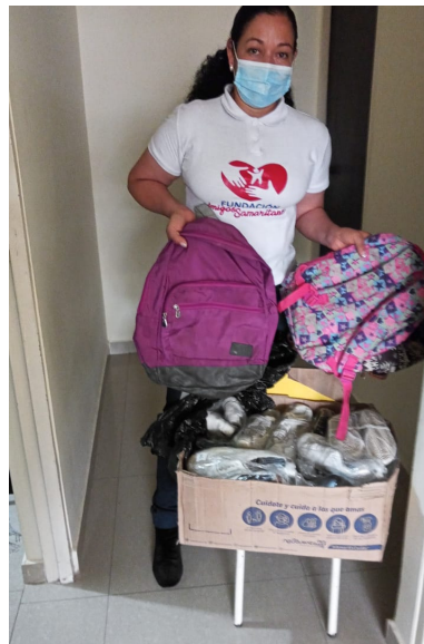
Entrega de donación de maletines y zapatos escolares a la Fundación Amigos Samaritanos

Día de atención: jueves de 9:00 a.m. - 4:30 p.m.