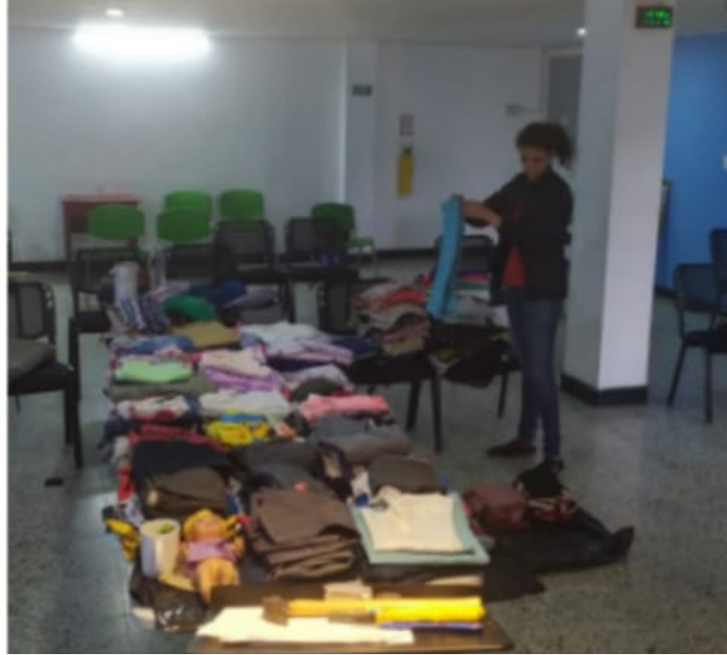
Clasificación de ropa y organización del centro de acopio

Horario de atención en la sede FundaZion