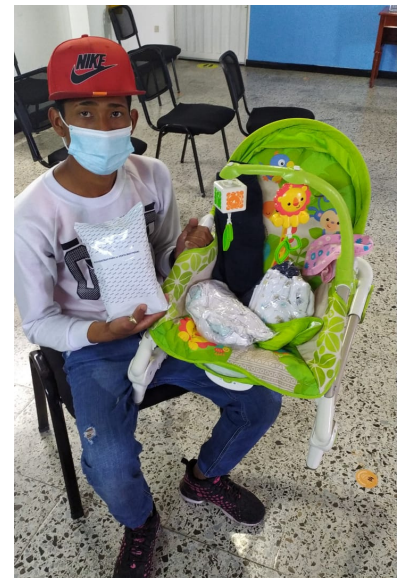
Entrega de ayudas humanitaria en la sede FundaZion