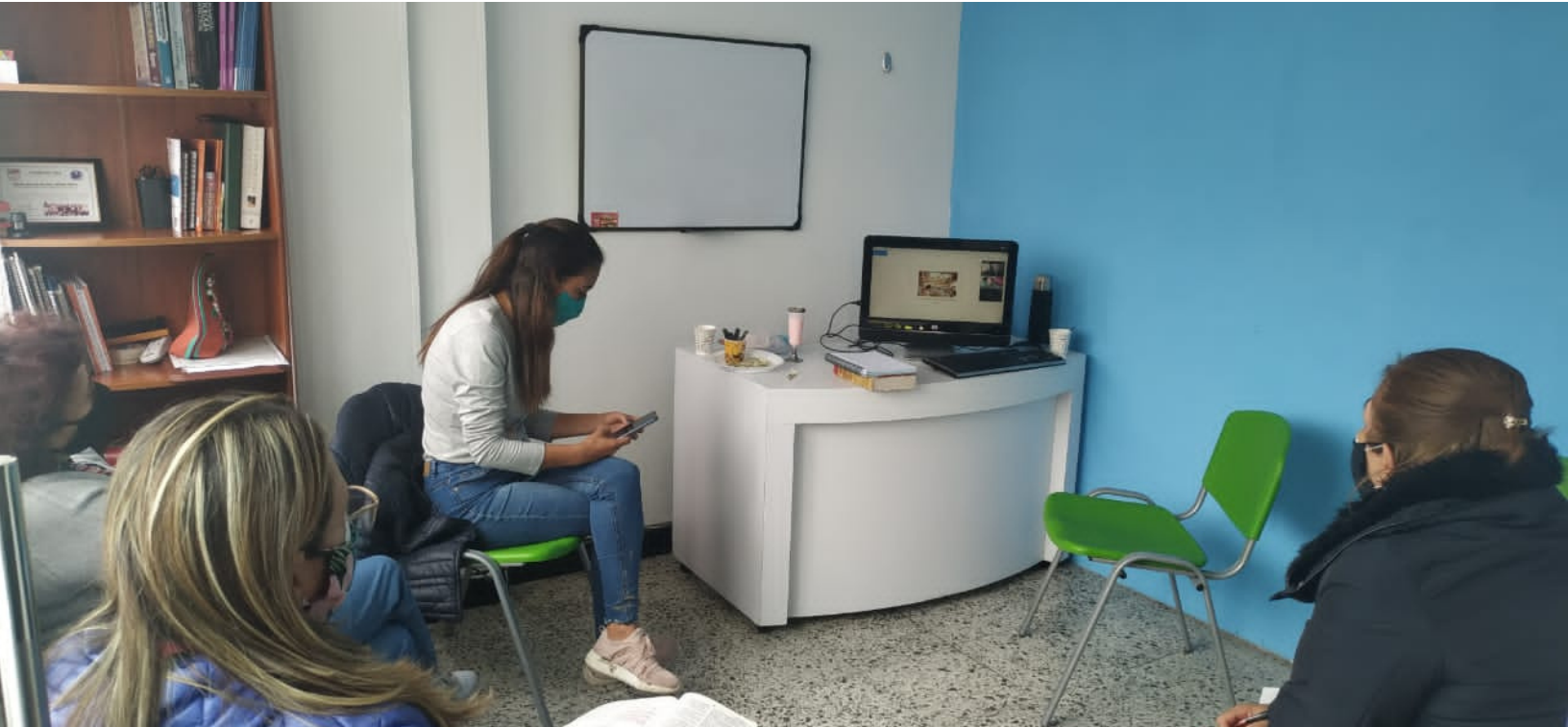
Reunión del equipo del Club de amigos